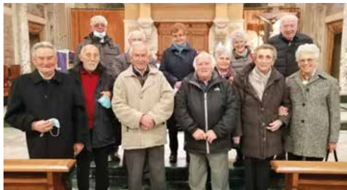
I Coscritti del 1941