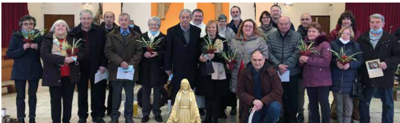
Anniversari di Matrimonio a S. Pio X (8 dicembre)